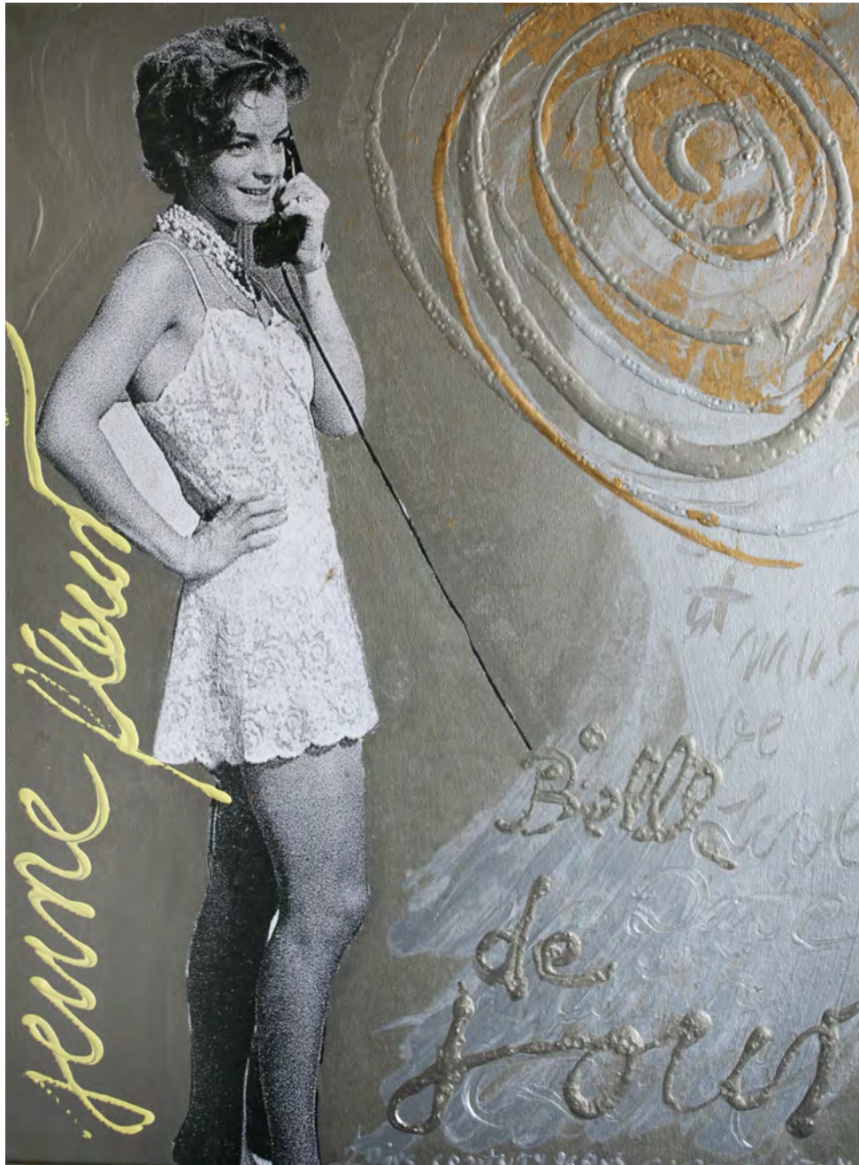
Jeune fleur | 130 x 100 cm | 2019