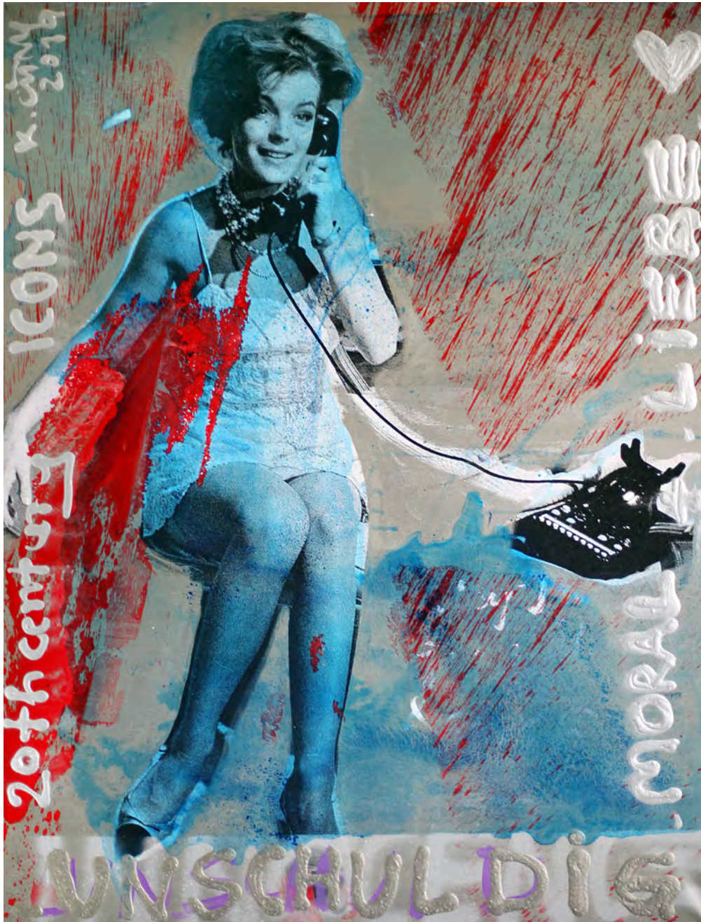
Moral & Liebe | 130 x 100 cm | 2019