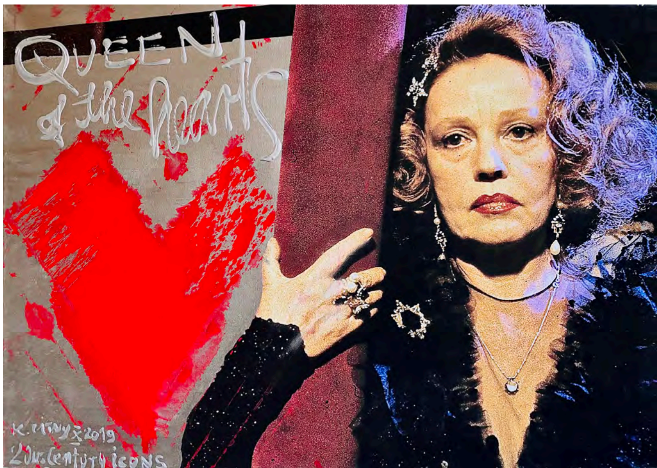
Queen of the Hearts | 130 x 90 cm | 2019