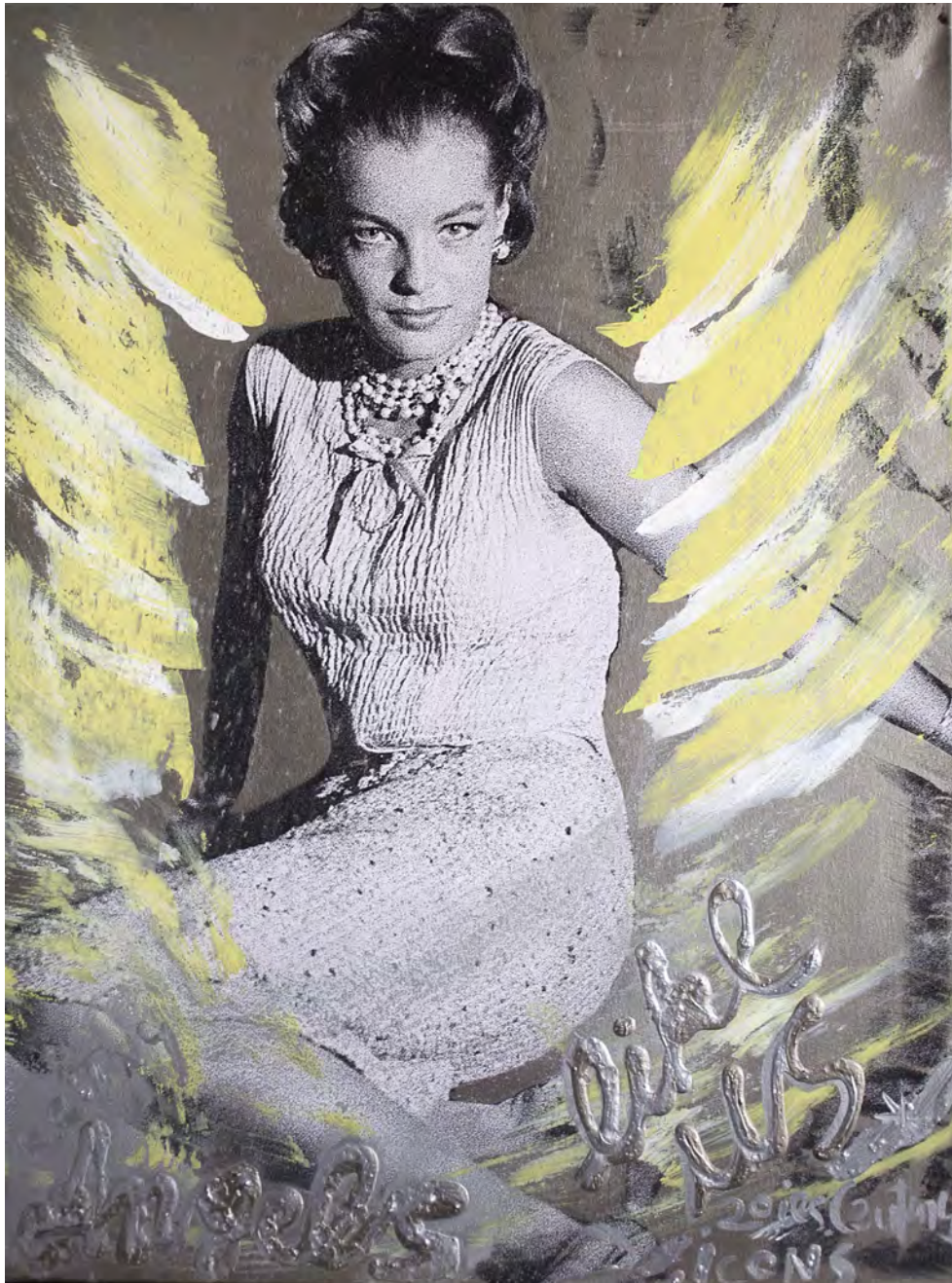
Angels like Us | 80 x 60 cm | 2020