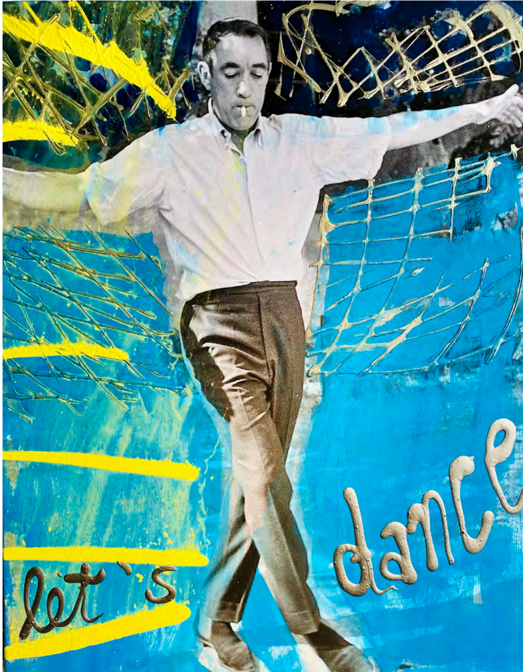
let's dance | 100 x 70 cm | 2020