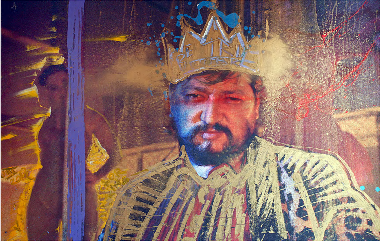
DIRECTOR KING | 150 x 100 cm | 2018