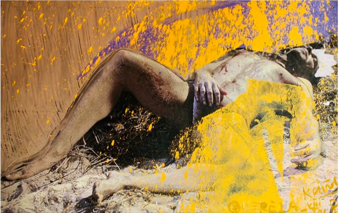
Querelle | 150 x 100 cm | 2018