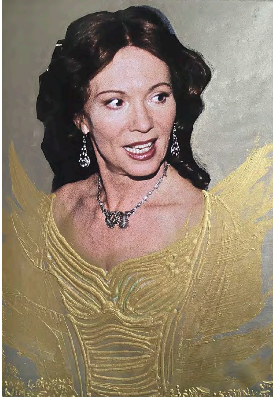
Wings of Light | 100 x 70 cm | 2020