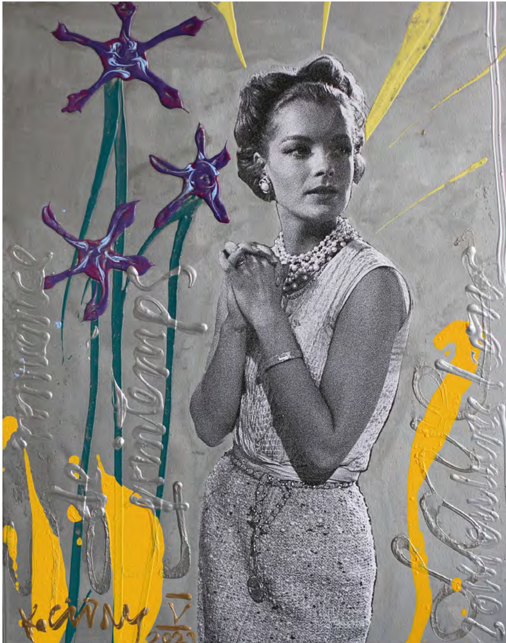
romance des printemps | 90 x 70 cm | 2021